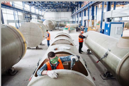
Производство г. Тольятти