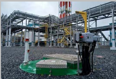
Производство и поставка 30-и комплектных КНС ПАО "СИБУР Холдинг" Западно- Сибирский Нефтехимический комбинат Г. Тобольск