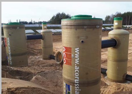
Индустриальный парк "Великий камень" "Оборудование для очистки поверхностного стока в составе ЛОС накопительного типа с самым большим в мире безбетонным аккумулирующим резервуаром АСО StormBrixx, Минск, Республика Беларусь