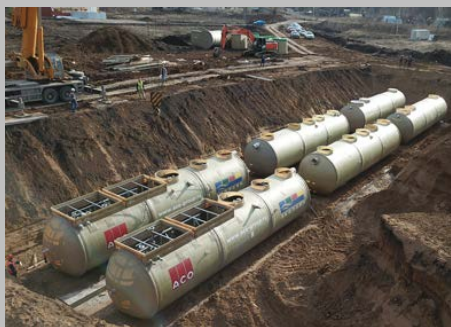
КОС ЭКО-Р-1000, ЖК "Цветы Башкирии", г. Уфа